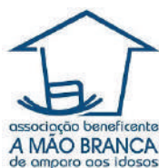
NCI Capão Redondo