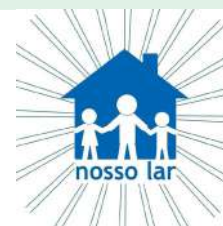
NCI Nosso Lar