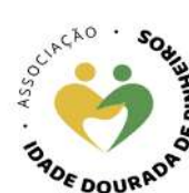
NCI Idade Dourada