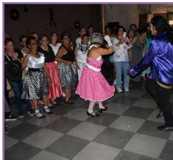
• Baile Temático anos 60/70 em comemoração aos 15 anos do Instituto Pinheiro