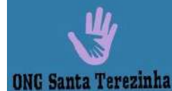
Organização Social Santa Terezinha