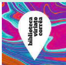
Biblioteca Viriato Corrêa