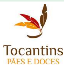
Padaria Tocantins - Santos