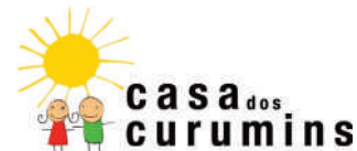
Associação Casa dos Curumins