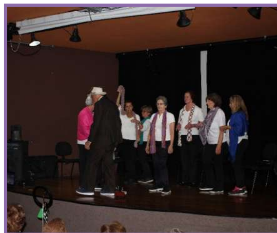
• Apresentação Cultural das alunas do Coral e Teatro na Biblioteca Viriato Corrêa