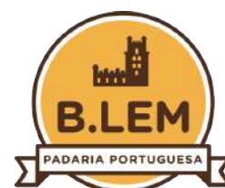
Padaria B.LEM Shop. Sta. Cruz