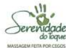
Serenidade do Toque