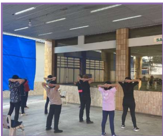
• Participação do Instituto Pinheiro em Ação Social na Igreja Nossa Senhora da Saúde