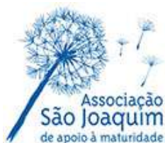
Associação São Joaquim