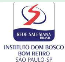
NCI Dom Bosco