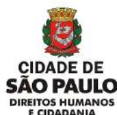
Polo Cultural da 3ª Idade do Cambuci